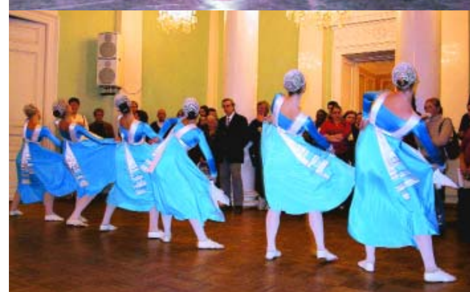
Der blev spillet teater for børn, lavet workshops for børn og voksne - og optrådte for de udenlandske festivaldeltagere.

velfærdssamfund har vi ofte de pædagogiske mål i centrum og aktiviteten som redskab for dem. Aktiviteten bliver sekundær - og sådan kan man jo ikke ska-