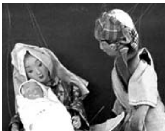
Den hellige familie: Maria, Josef og Jesus-barnet i Teatret Rods kuffertdukke-udgave.