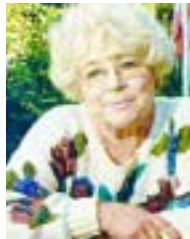
Familie-teatrets stifter og leder