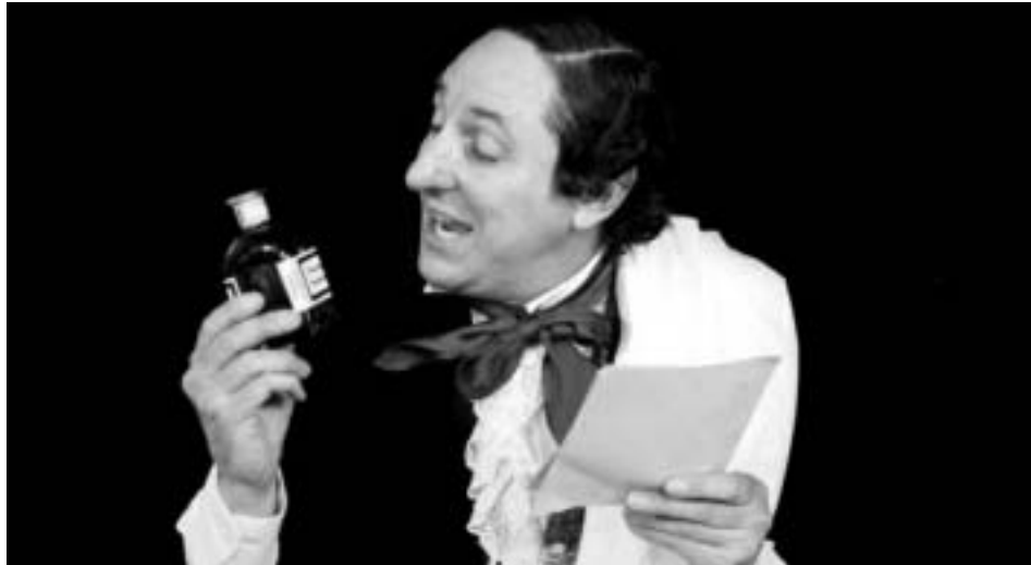
Mister Jones kan spille sin 'H.C. Andersen' som refusionsgodkendt forestilling.