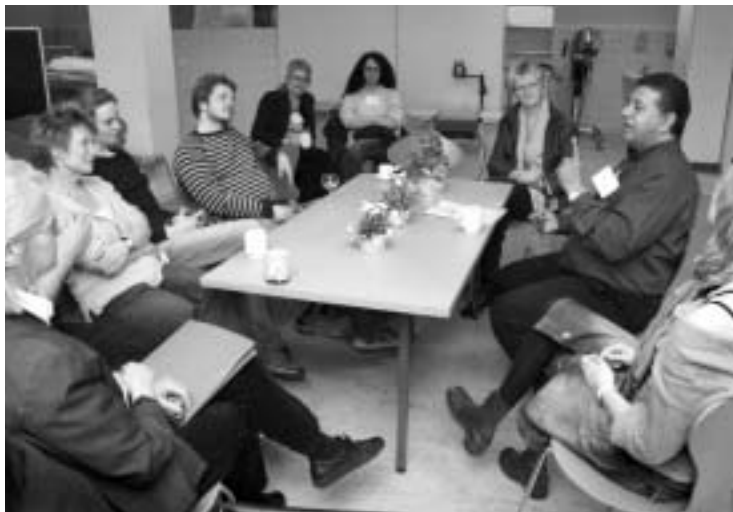
Fra sidste års festival i Nykøbing Falster, hvor formidlerne bl.a. stiftede bekendtskab med den israelske teatermand Razi Amitai (to fra højre), der holdt oplæg over temaet: Børneteater i alle kulturer.