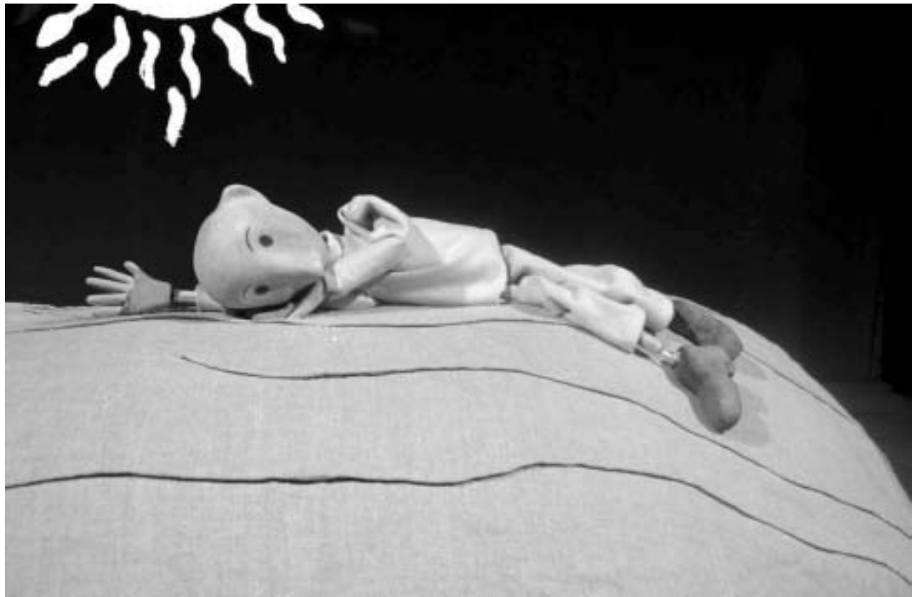
Rotten Muffa i ørkenen i Det Lille Verdens Teaters stilfærdige fortælling.

Til hjælp har hun udover båndet musik af Jonny Schmidt ganske få rekvisitter og dukker. Tingene dukker op undervejs mens hun fortæller: En lille palme-gren, en stor rød sol, månen og stjernerne. Fuglen, som taber det frø som vokser op til rose. Den lille ørkenrotte Muffa. Den sultne slange. Og glasset med