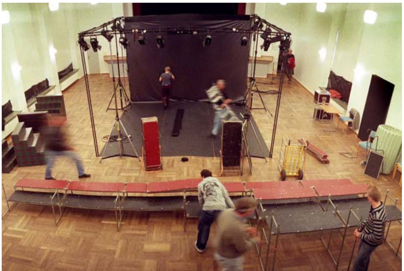
Scenetjeneste (th) – der knokles for at stille op og pille ned. Næsten 150 scenografier og publikumsopbygninger skulle proppes ind på festivalens spillesteder