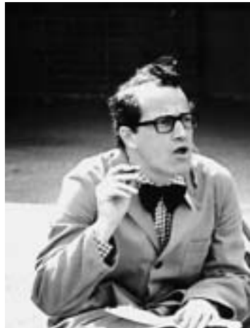
Ole Funchs vindtørre sløjdlærer har ikke nem til smil.

»Det er skørt!« siger et barn med overblik. Problemet er, at det også er kedeligt. Og surt. At forestillingen er så mande-nørdet