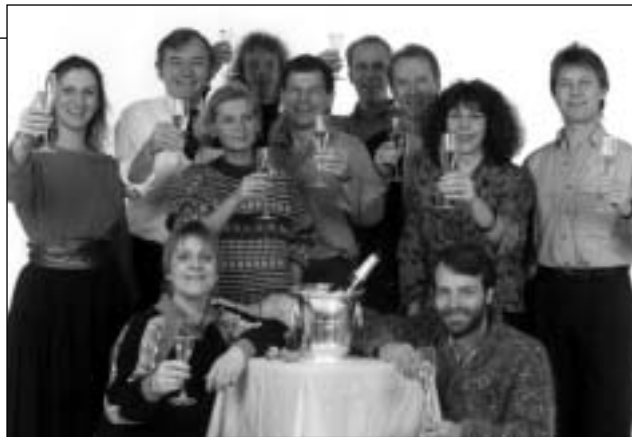
I 1989 modtog Artibus som de første Danmark Teaterforeningers nystiftede pris som bedste danske børneteater

Men netop bekymring er til gengæld en kunstart, man gennem tidernes ugunst har lært at mestre til fuldkommenhed.