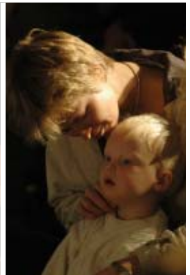
De små kulturbrugere vises venligt på plads (ø.v.tv.) – Stjernen i Gruppe 38's 'En lille sonate' varmer op og giver anledning til en grublen over, om hønen, ægget eller skuespillerne kom først... (ø.v.midt) – De voksne var på plads med deres kære små – og fulgte med i både forestilling og oplevelsespotentialer hos afkommet... (ø.v.th)