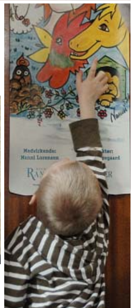
Børn i alle aldre besøgte festivalen. Som billederne rundt om denne tekst viser, må en del af tiden bruges på at stå i venteposition, inden man kunne lukkes ind i kunstens hellige haller. Og så var det jo godt, at der flere steder ved festivalens spillesteder var hængt buede spejle op til tant og fjas