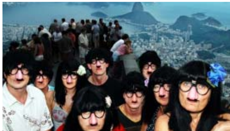
Batida hører til Danmarks flittigste kulturambassadører. De har i tidens løb gæstet 23 lande med 12 forskellige forestillinger – her Batidas 'Ouverture'-hold i Rio i Brasilien i år.