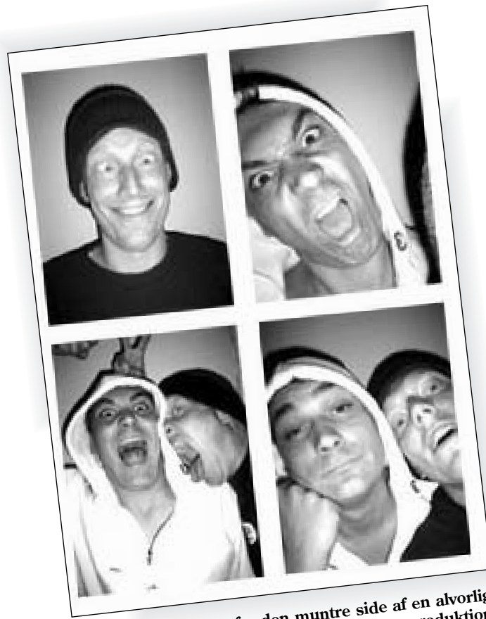
Shapshots fra den muntre side af en alvorlig sag.