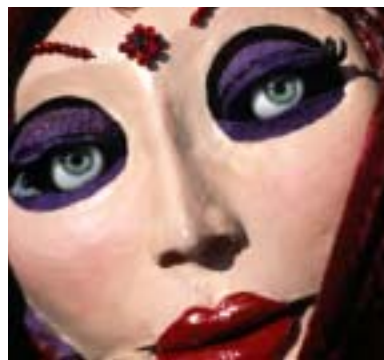
Den skønne diva lever i et spændende scenografisk-mekanisk univers.

Heldigvis, for uden den havde det sceniske og musikalske kaos været knapt så sjovt, og meget