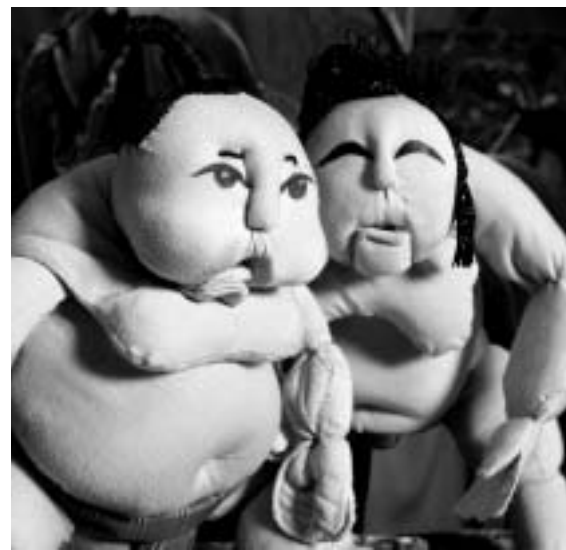
Månegøgl tager fat om Japan i sin nyeste forestilling: Sumobryderne er nogle helt forrygende og urkomiske dukker, der slår om en kage!

Sig så ikke, at lupholderen altid er negativ, kritisk og sur. Nej, han går ikke imod. Han tager ting for deres pålydende og tænker med. Han synes faktisk, at regeringen og Dansk Folkeparti er nogle festlige og lystige kulturpolitiske fætre, der fortjener visionært medspil i stedet for modspil.