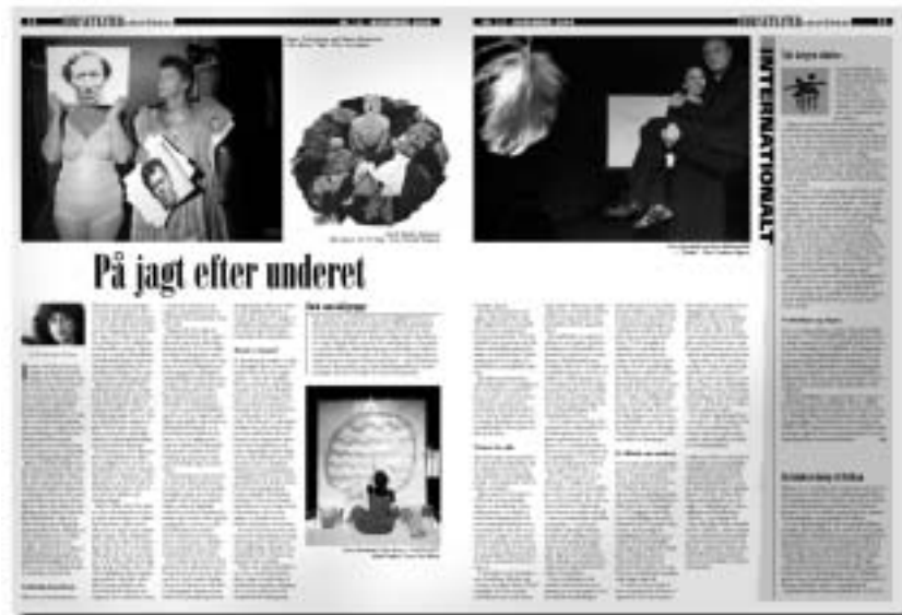
Sådan så side 12-13 ud i BTA 131 – da den ankom til trykkeriet...