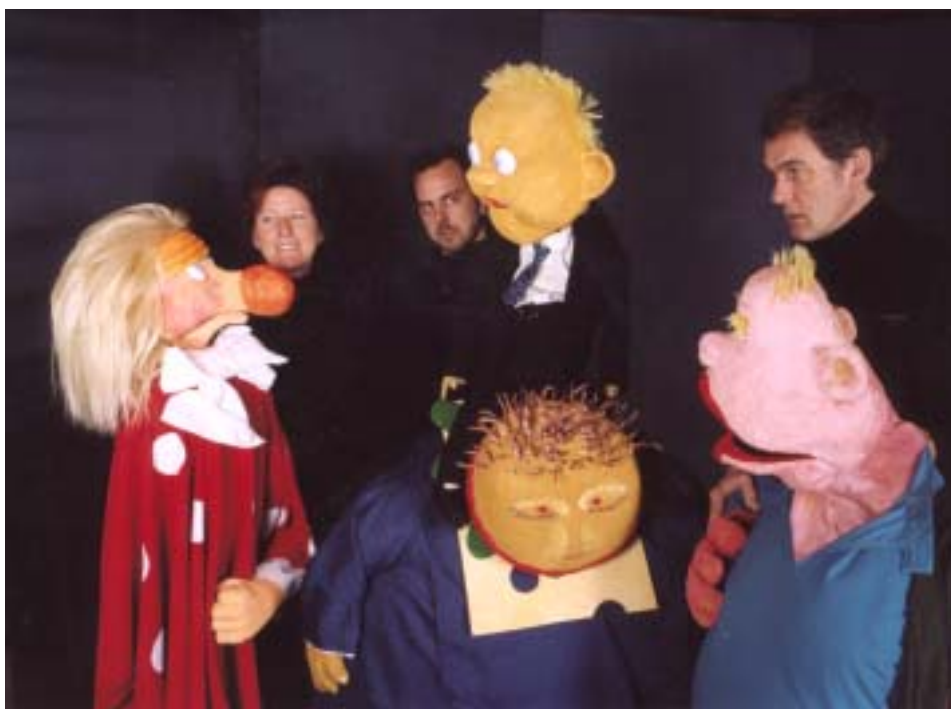
De komiske, legemstore dukker understreger nutidssatiren i Undergrundens »Arv min arv«.