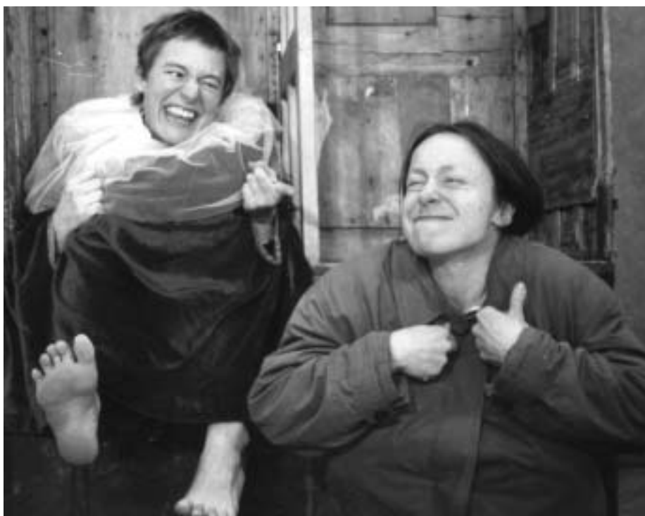
(papir) Der er både store armbevægelser og sympatiske budskaber i Kimbris »Pænt goddag«