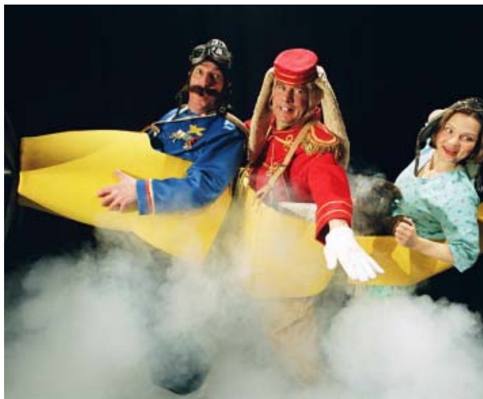
Der sidder tre mennesker i en flyvemaskine i Vestvoldens Bjarne Reuters dramatisering.