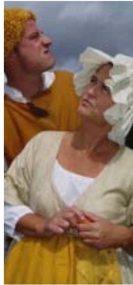
Fra Den politiske kandestøber i »Holberg en suite«.