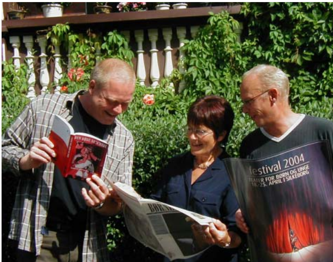
UBOT med de tre hovedsøjler i udvalgets arbejde: Den Røde Brochure, Børneteateravisen og festivalen.