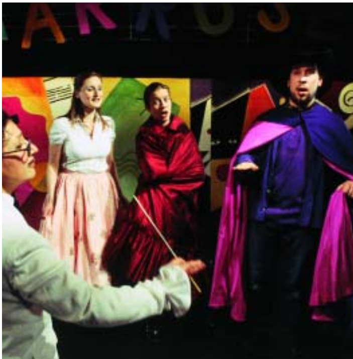
Rialto Teatret tog i foråret livtag med børneoperaen i form af forestillingen »Operakarrusellen« i instruktion af Pia Rosenbaum