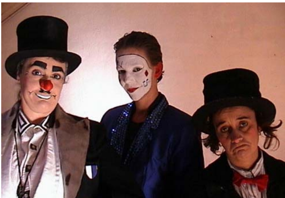
(digipix/mail): Klovnefigurer på rad og række i »Summa Summarum«. Foto: Teater OM

Pointen er, at de allerede er døde og derfor – som den lille gadefejrer siger – lige så godt kan holde fred, for i døden er alle lige. At de er døde, vises ved, at spillerne er blevet til hver