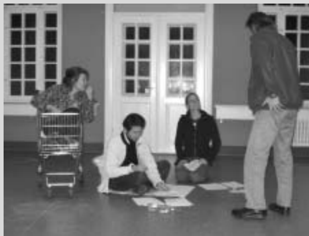
Et kig ind i det senest kuld spirers værksted op til afgangprojektet i december 2003. Nu er et nyt kuld på vej.

Her kan man også læse om de resultater, som de tidligere projektdeltagere har opnået. caj